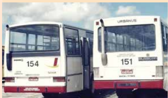
► Veículo 154, Caio Gabriela | Veículo 151, Busscar Urbanus | Década de 90