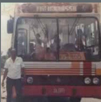
► LP 352, Marcopolo, ano 1988