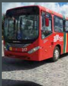
► Comil Svelto, ano 2004