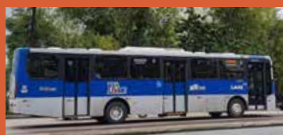
► Caio Apache Vip, padrão BRT, ano 2020