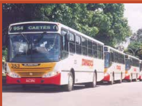
► Busscar Urbano, ano 1999