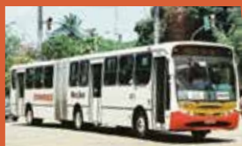
► Caio Apache Vip, articulado MaxBus, ano 2002