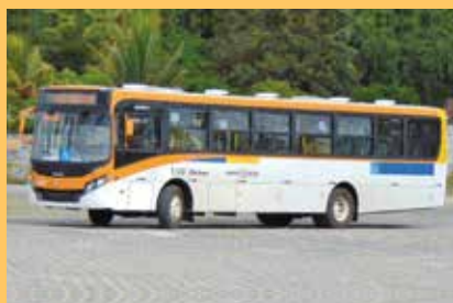
► Caio Apache Vip, ano 2016