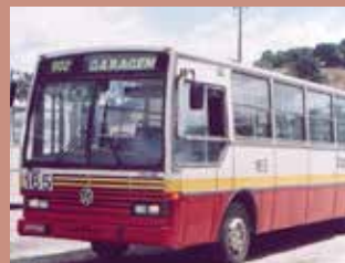
► Caio Gabriela, década de 90