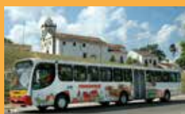
► Caio Apache Vip, articulado MaxBus, ano 2002