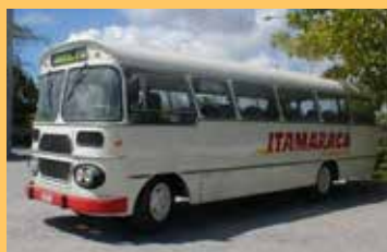
► Mercedes Benz, ano 1967, modelo LP321. Carroceria CAIO modelo Jaraguá.

Nesta edição especial, não podíamos esquecer da nossa frota. Confira alguns veículos que fizeram parte da História da Itamaracá.