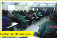
Gestão da Manutenção