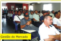
Gestão do Mercado

O resultado da Pesquisa de Clima Interno, a Escola de Motorista em tempo integral e a locação do Espaço José Anchieta para eventos, foram alguns dos assuntos divulgados na Gestão Aberta no mês de outubro.