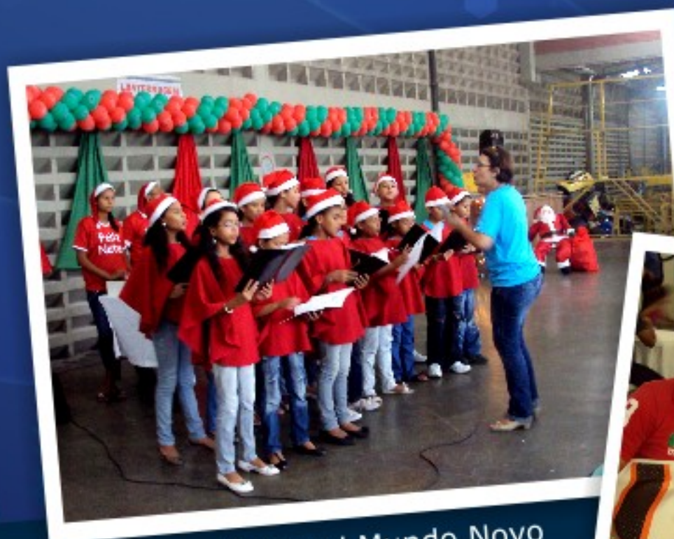
Apresentação Coral Mundo Novo