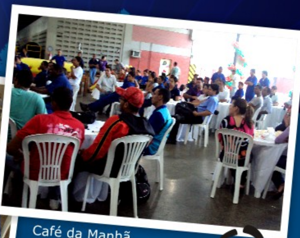
Café da Manhã