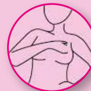
DEBAIXO DO BRAÇO ESQUERDO