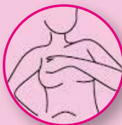
DEBAIXO DO BRAÇO DIREITO

Toda mulher com 40 anos ou mais deve realizar, anualmente, exames de ultrassonografia e mamografia. Já as que tem entre 50 e 69 anos devem fazer pelo menos uma mamografia a cada dois anos. É importante que a mulher sempre faça o autoexame. Através do toque é possível perceber alguma alteração, como a existência de algum caroço no seio. Se cuide!