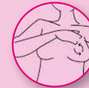
EXPLORE REALIZANDO CÍRCULOS