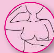
TODA A MAMA