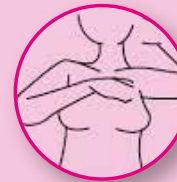
POR CIMA DA MAMA