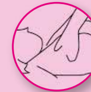
DEITE-SE E TOQUE-SE